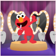
Canción del cepillo de dientes Plaza Sésamo