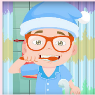
Canción cepilla tus dientes Blippi