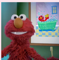
El baile Diente Sesame Workshop