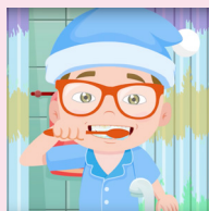
Canción cepilla tus dientes Blippi